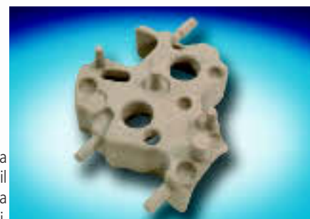
Anima di una camicia acqua per il getto di una testa a 6, 8, 12 o 16 cilindri.